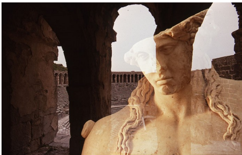
Jedna z fotografií, které budou vystaveny

Skutečný vizuální, veskrze dobrodružný zážitek, který návštěvníka přenesne za hranice běžného pojetí fotografie a dá mu možnost nahlédnout do osobitého světa umělcovy tvorby. Jak se sám mistr vyjádřil: "Toto je v podstatě moje projekce, vnímání života: encyklopedie vizionáře, badatele, historika zaměřeného na tvorbu filosofů, malířů, vědců, kteří celý svůj život zasvětili záhadám vize." Fotografie jeho Římské civilizace jsou kulminujícím bodem projektu, jehož počátky sahají do konce 80.let.