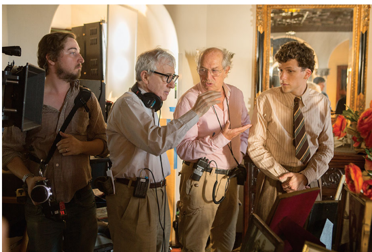
Na této fotografii je zachycen Woody Allen spolu s Vittorioem Storarem na backstage filmu "Cafè society"